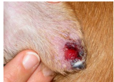
Leishmaniose-bedingte Hautveränderung an Hundepaw